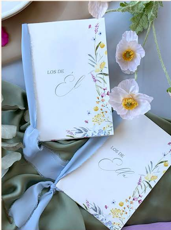
LIBRO DE VOTOS