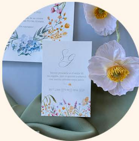
TARJETA N. CUENTA