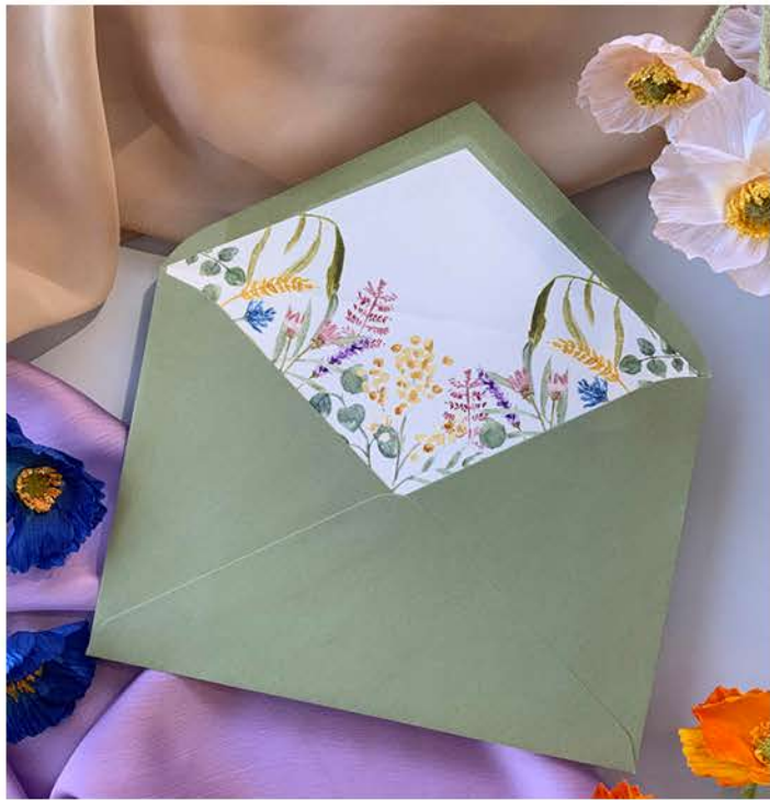
Invitación verjurado y sobre basic