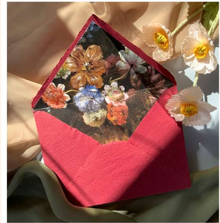
Invitación verjurado con sobre artesanal